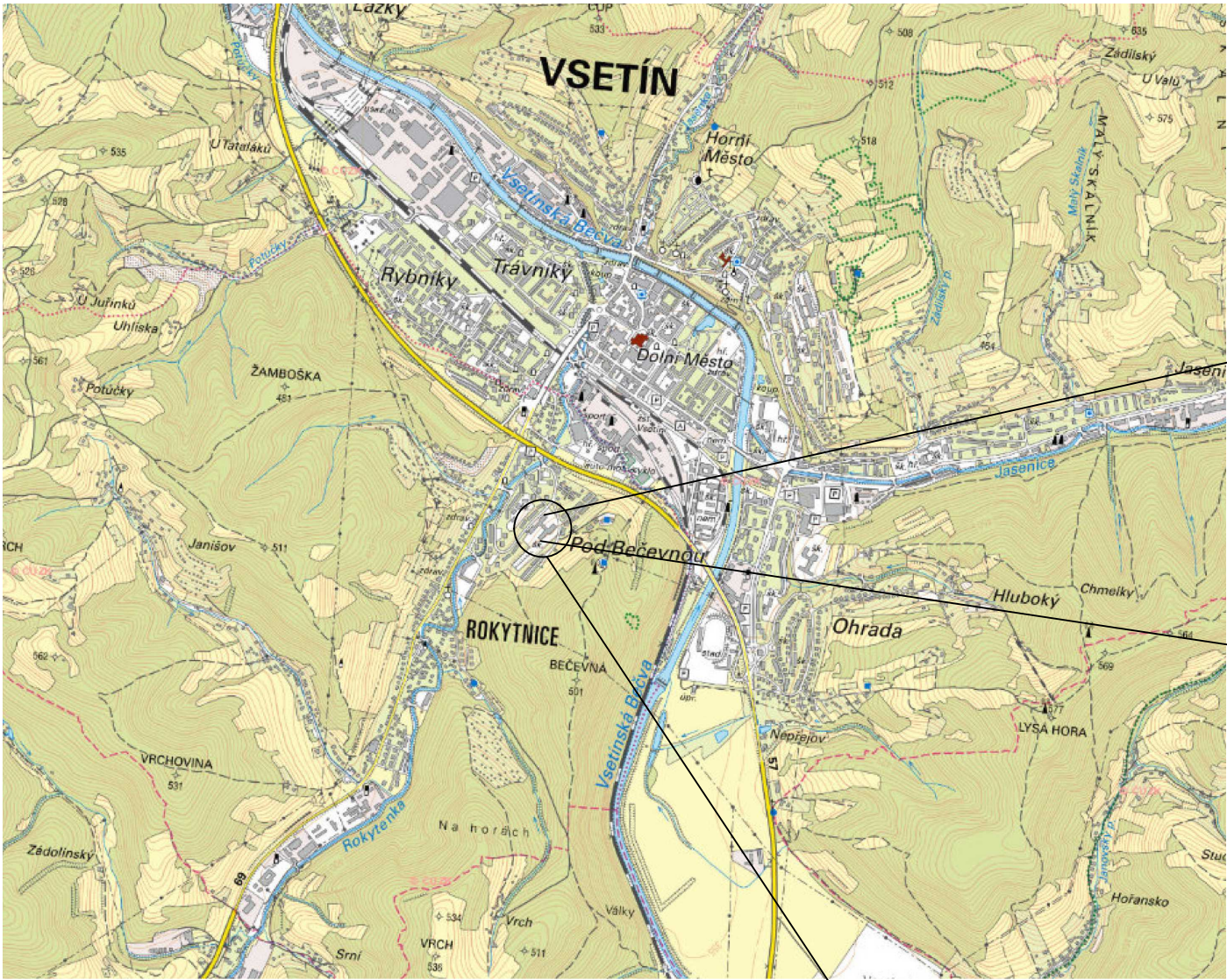
ZŠ VSETÍN ROKYTNICE